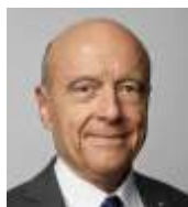
Alain Juppé Maire de Bordeaux

Tous mes vœux de réussite accompagnent les acteurs de cette belle saison.